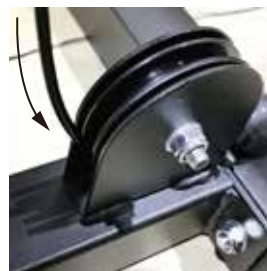
※ワイヤーのたるみ

※注 特に足周りについているワイヤーはワイヤーが横に張っている為、たるみやすいです。